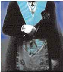
Abbildung rechts: Der Meister vom Stuhl in freimaurerischer Bekleidung mit den Amts-Insignien: der Winkel am breiten Band; der Hammer in der rechten Hand gewährt die rituelle Ordnung; Schwarz, Bijou und weiße Handschuhe gehören zur Tempelarbeit des Freimaurers.

Baden-Württemberg; Bayern / Sachsen; Berlin / Brandenburg; Bremen; Hamburg; Hessen / Thüringen; Niedersachsen / Sachsen-Anhalt; Nordrhein-Westfalen; Rheinland-Pfalz / Saar; Schleswig-Holstein / Mecklenburg-Vorpommern